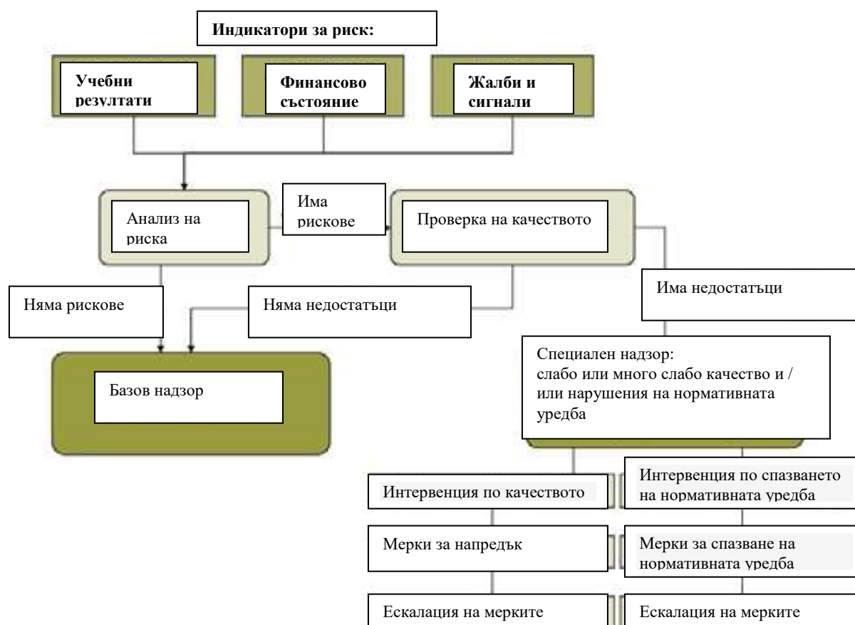
Схема на „Риск-базирания надзор”

Същевременно всяка година Инспекторатът по образованието планира и извършва и тематични проверки, които обхващат представителна извадка от училищата в страната. Така например, за 2011 г. четирите тематични фокуса са били: зависимост на доходите от образованието, уязвими ученици, учителите, мениджмънт и финанси.